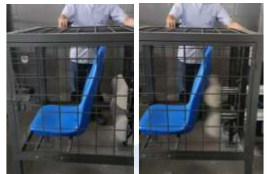
Realizamos ensayos mecánicos reales.