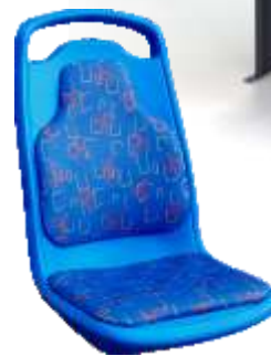
Version con cojines tapizados y acolchados.